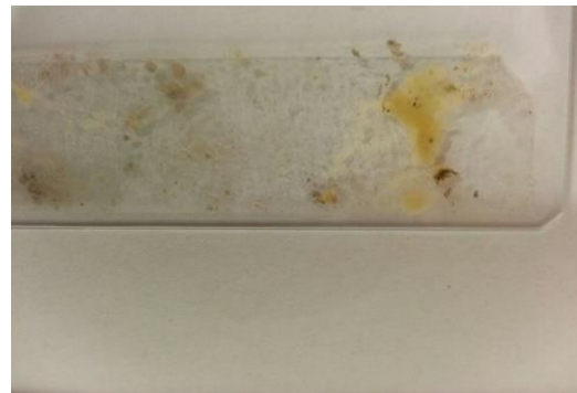
Tesaabklatschpräparat unter dem Mikroskop