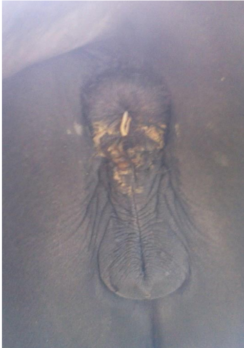
Pfriemenschwanz, der zur Eiablagein Erscheinung tritt