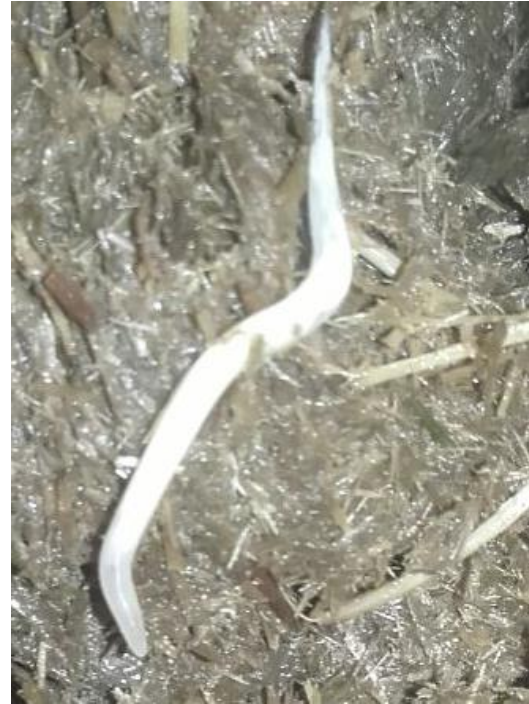
Oxyuris equi in seiner vollen Länge